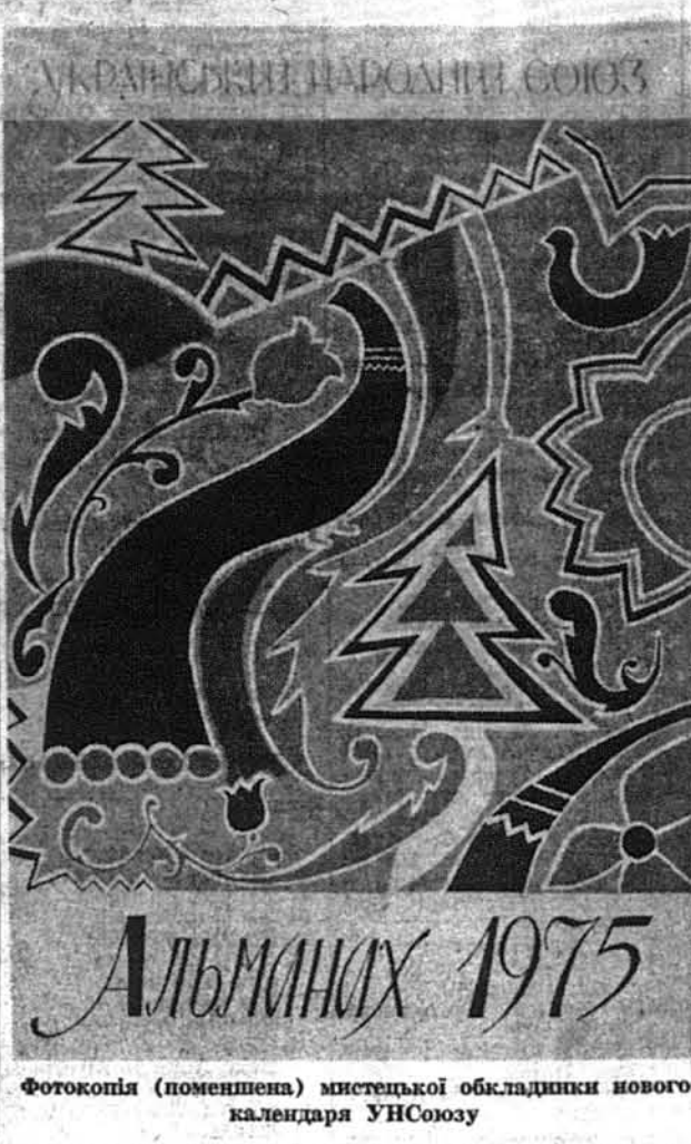
Фотокопія (поменшена) мистецької обкладинки нового календаря УНСоюзу

(про архітекта Аполінарія Осадцу), Теодор Курпіта: "Вертеп" (віршувана гумореска про українських діячів), Іванна Савицька: "Чудо на Восьмій вулиці", Любов Коляска: "Вожий чоловік", д-р Ю. Шумовський: "В Гімалаях", Роман Савицький: "Видатні музика з-близка", Василь Ємець: "Коли воскресла кобзарська слава", Іван Мартинюк: "Адріанські звичаї", Н. Н.: "Електричні вогні", К. Крушельський: "Описи України Воляни", Ол. Рана: "Ніч в університеті", Василь Онуфрієнко: "Неповторна мить" (вірш) та ін.