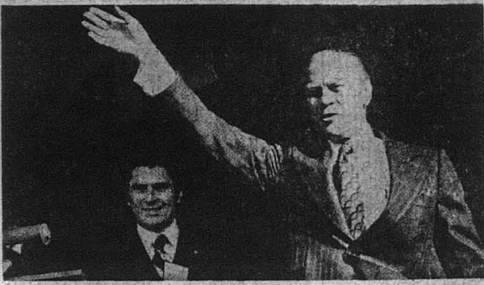
Джон В. Ворнер (зліва), голова Адміністрації 200-річчя Американської Незалежності, разом з президентом Джералдом Фордом під час недавнього їх спільного виступу в підготовці до відзначення 200-річчя Американської Незалежності в Александрії у Вірджинії.

Вашингтон. — Лютийне число "Вайсентеніал Таймс", офіційного органу Адміністрації 200-річчя Американської Незалежності (American Revolution Bicentennial Administration), подаючи обширні інформації про відзначування цієї знаменної річниці по цілій країні і в деяких чужих державах, зазначає, що ці відзначування, які починаються вже 1-го березня цього року, проходять під трьома окремими, але тісно пов'язаними гаслами: "Спадщина '76'", "Фестиваль ЗСА" і "Горизонти '76'".