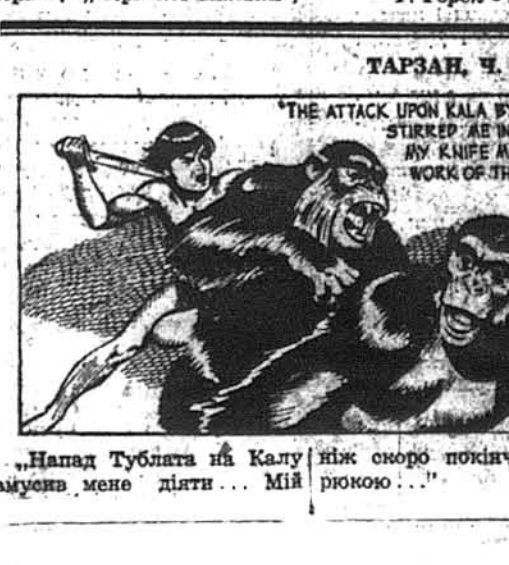
„Напад Тублата на Калу мучив мене діяти... Мій ніж скоро покинув із тварюкою...“

Туживим рефреном долітас до наших вуз: „Драцуюсь влігсе з роботою“. Чи це вже дійсно квіте вечерниць? Нікому не хочеться покидати зал. І зараз чуєте голосне, оптимістичне: „До побачення на другий рік з нагоди 25-літнього відновлення видавництва „Червоної Калини“ і 50-літнього пластового Заголу „Червоної Калини“. Хтось за спиною переконливо доказує, що всеж такі Вечерниці „Червоної Калини“ найкращі“.