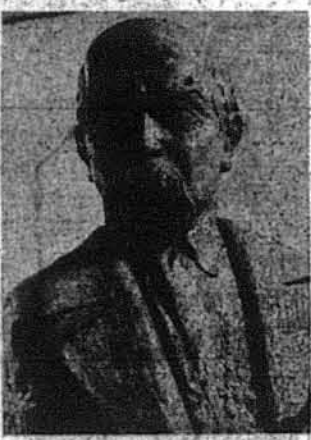
Світлина проекту бронзового погруддя Т. Шевченка, виготовленого аргентинським скульптором Леонардом Родрігесом для запланованого пам'ятника Кобзареві в Енкарнасіоні, Парагвай.

Буенос-Айрес, (М.Д.) — Українське представництво в Аргентині висловлює, що по відношенню до відкриття пам'ятника Тарасові Шевченку в Парагваї були перешкоди, бо в березні ц. р. з нагоди 360-ліття заснування міста Енкарнасіон, відкрито лише площу — парк, де буде встановлений пам'ятник, а його відкриття відбудеться шостою на грудень наступного року і точний розклад буде оголошено проголошено.