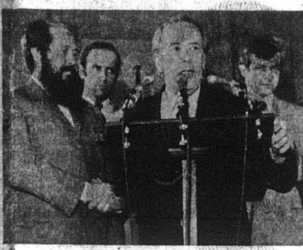
Сенатор Генрі Джексон представляє Олександра Солженіцина на влаштованому в честь Солженіцина сенатському прийнятті у Вашингтоні 15-го липня.