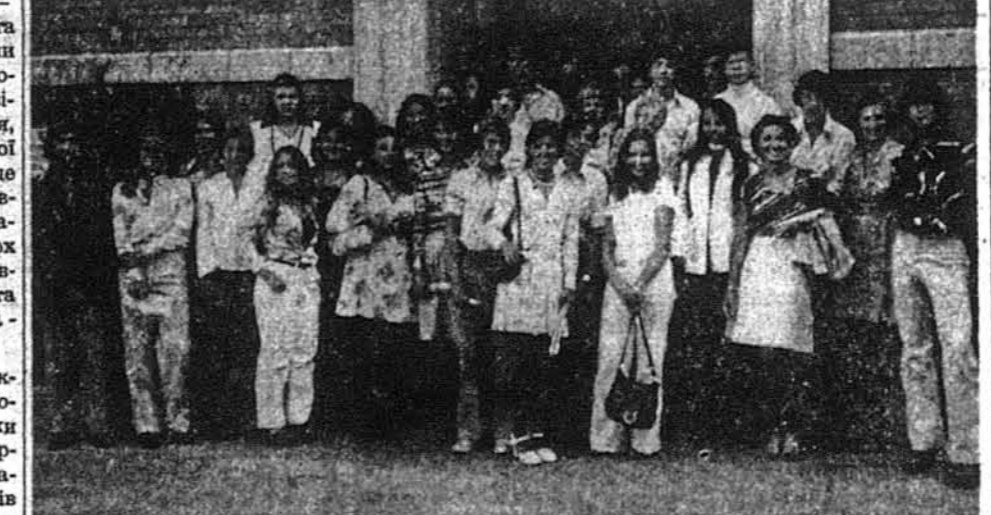
Учасники Курсів Українознавства на Союзівці та їхні угителі - опікунки під час відвідин у „Свободі“

В членській кампанії 1975 року предявно разом до 18-го серпня 1,713 нових членів.