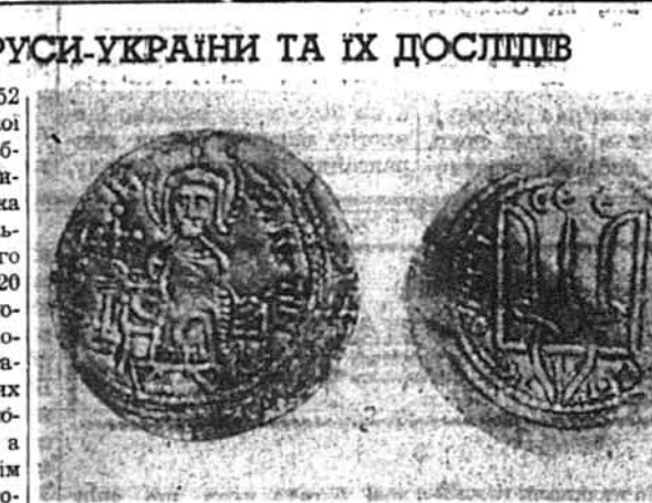
Срібна монета кн. Володимира Великого, четвертої емісії-групи. Карбована в Києві в рр. 1000-1015

жеського, виораного 1852 б. м. Ніжева, Чернігівської обл., в якому було 200 срібних монет князя Володимира Великого, і Святополка Окаяного, та т. зв. киявського скарбу, викопаного 1876 р. в Києві, де було 120 срібних монет тільки Володимира Великого першої його срібної емісії-групи. Каталог були друковані в тих самих збірниках: "Киявський скарбу" в третім (1968 р.) а "києвського" в четвертій (1971 р.). В біографіях монет дослідник точно переповіла шляхи їх "мандри" з колекції до колекції, подала для кожної біографію й дуже цінні оригінальні знімки. Це здається першим раз опубліковано знімки всіх монет. Якщо повний каталог буде так зложений, то це буде великий вклад в нумізматику Русь-України, як науки, незалежно від цього, що їх уважають за перші російські монети. Дослідник виявляє, що майже всі наші княжі монети були карбовані на території теперішньої України й майже всі були там знайдені, але, як бачимо, їх вивчали не в Києві а в Ленінграді. Це пояснюють тим, що подавляюча їх більшість зберігається в Ленінграді й Москві, куди очевидно їх везли з України. (Зі згаданих дослідів "Ермітажу" з 1964 р. знаємо, що на 11 відомих золотих княжих монет, але збережених тільки 10, там