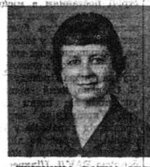
ДРУЖИНА, ДОЧКА, СЕСТРА, ТЕТА, ПІВАГРОВА, БРАТАНКА та КУЗИНКА