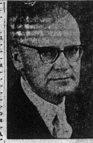
Проф. д-р Вол. Кубійович патронують зустріч українського громадянства з проф. (Закінчення на стор. 3-й)

В дні 11 і 12 жовтня ц. р. в Торонті відбулися під проводом головного редактора Енциклопедії Українознавства проф. д-ра Володимира Кубійовича та при співучасті його найближчого співробітника д-ра Атанаса Фіголя, редакційна конференція в справі закінчення видання газетної (словникової) Енциклопедії Українознавства українською мовою та заочаткування англійської газетної Енциклопедії Українознавства (АЕУ2). В конференції брали участь професори американських і канадських університетів: Богдан Будурович, Всеволод Голубничий, Всеволод Ісаєв, Юрій Луцький, Василь Маркус, Петро Потічний, Іван Тесля і Юрій Шевельов. На нараді не могли присутити ред. Богдан Кравців і проф. Олександр Оглоблин з причини неутра та проф. Богдан Воцюрків з причини особистих перешкод. Конференція зорганізувала проф. Юрій Луцький. Учасники наради заслухали проєкт проф. Володимира Кубійовича та перекладалися всі важливі питання, зв'язані з виданням англійської газетної Енциклопедії Українознавства (АЕУ2), яка має бути новим твором, призначеним для широкого наукового світу. У висліді наради вирішено скласти літературну редакційну конференцію в травні 1976 р. Дня 15-го жовтня ц. р. в Торонті відбулася нарада членів управи Патронату з представниками місцевих клубів Українських Професіоналів і Підприємців та Станції Б-ва і УД УНА, які