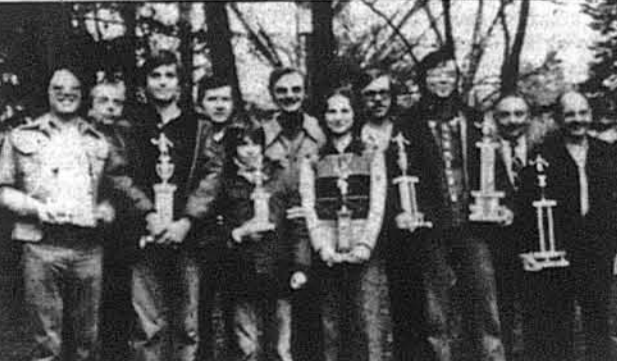
Учасники змагань за Першості УСЦАК в настільному тенісі на Союзівці 15 і 16-го листопада 1975.

Союзівка. — Крім популярних вже тенісних турнірів і плавальних змагань, які кожного літа притягають сотні українських спортсменів Америки і Канади, які виховно-відпочинкова оселя УНСоюзу стала місцем відродження українського настільного тенісу, гостюючи минулої суботи і неділі, 15 і 16 листопада, турнір за індивідуальні першості Української Спортової Централі Америки і Канади (УСЦАК), в якому взяло участь 26 змагунів і змагунків. Тур-