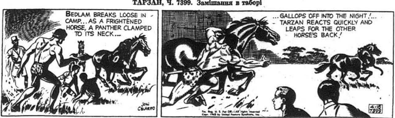
В таборі створилося велике замішання, коли переляканий кінь, на шні якого сиділа пантера, помчав в темряву ночі!... Тарзан зареагував ментально і скочив на хребет другого кіня!

UKRAINIAN FUNERAL DIRECTORS AIR CONDITIONED Обслуґа ЦИРА і ЧЕСНА. Our Services Are Available Anywhere in New Jersey. Також займаємося похоронами на цитирті в Ванді Врукі і перенесенням Тілівних Останків з різних країн світу. 801 Springfield Avenue IRVINGTON, N.J. NEWARK, N.J. ESsex 5-5555