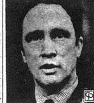
Прем'єр П. Е. Трудо

Вінніпер (КУК). — Дня 20 листопада ц.р. в Домі Української Молоді в Едмонтоні відбулася понад 2-годинна зустріч українських громадян Едмонтону і Алберти з прем'єр-міністром Канади П.Е. Трудо. Після нарад відбулих 12 вересня 1975 з Екзекутивною Центральною КУК у Вінніперу, це була друга важлива зустріч прем'єр-міністра Канади з українською громадою в Канаді цього року. Прем'єр-міністр брав участь у цій зустрічі в товаристві сенатора Е.А. Гейстінга, спеціального асистента Р. Роберта і бувшого федерального посла з Алберти А. Сулятицького.