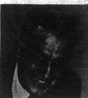
Сенатор Кліффорд П. Кейс

Вашингтон. — Сенатор Кліффорд П. Кейс із сенату Нью-Джерсі, навізуючи до законопроєкту вже раніше оголошеного в Палаті Репрезентантів конгресменом Міллісент Фенвік з Нью-Джерсі, висів свій законопроєкт в Сенаті про створення 11-ти членової комісії для слідкування за порушеннями людських прав в ССРСР. Законопроєкт сенатора Кейса, зголошений в понеділок, 17 листопада, і зареєстрований під числом С. 2679, є ідентичний із законопроєктом конгресменки Фенвік, який був зголошений нею під числом ГР 9466 ще 20-го жовтня і вже до половини листопада був піддержаний понад 40 конгресменами. В основному, законопроєкт пропонує створення спеціальної комісії, яка включала б по чотирьох представників Сенату і Палати Репрезентантів та по одному з Департаменту Оборони і Торгівлі. Головним завданням комісії мало б бути слідкування за порушеннями прав, включених в Гельсінкську декларацію, що її минулого серпня підписали голови 33-ох європейських держав та ЗСА