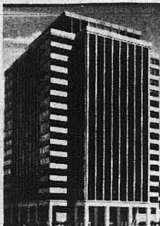
Українська Будівля УНС