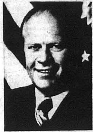
Президент Дж. Форд