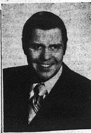
д-р Мйрон Курпаса

Вашингтон, Д. К. — Коло сотні чільних представників різних етнічних груп та редакторів етнічних прес взяли участь в цілоденній конференції, що її влаштував Білий Дім тут у вівторок, 9-го березня, заходами Бюро Публічних Зв'язків і д-ра Мйрона Курпаса, спеціального асистента президента Джералда Форда для етнічних справ. В рамках цієї першої з ряду запланованих публічних зустрічей, учасники мали нагоду стрітнутися з президентом Фордом в Білому Домі та почути низку доповідей представників уряду на актуальні теми внутрішньої і закордонної політики ЗСА. Після кожної доповіді учасники конференції мали нагоду коментувати доповіді, ставити запити та висловлювати побажання в імені етнічних груп і організацій, які вони представляють.