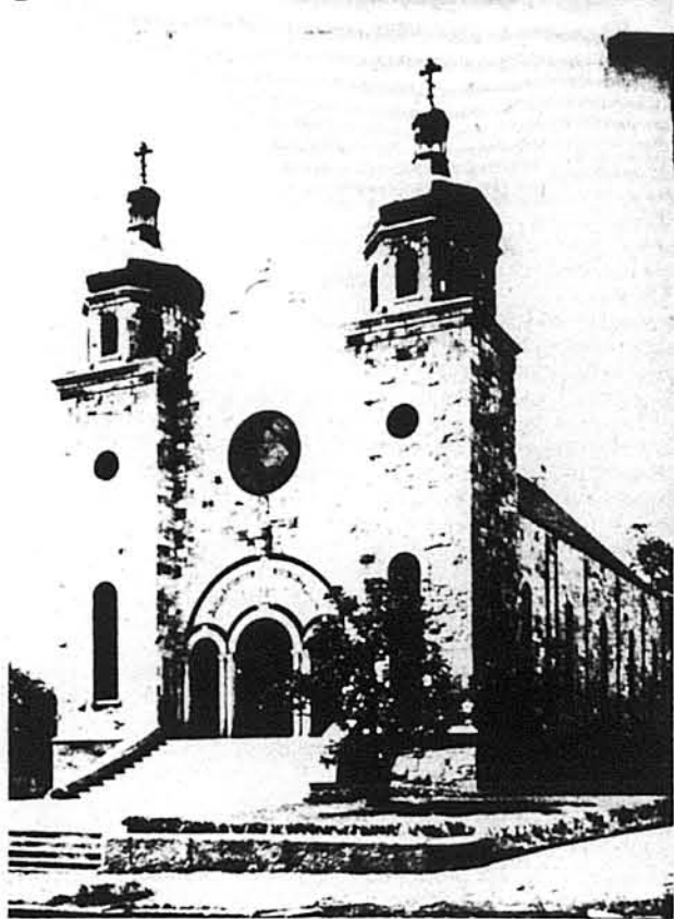
Церква св. Архископ Михаїла у Вунсакеті, Р. А.