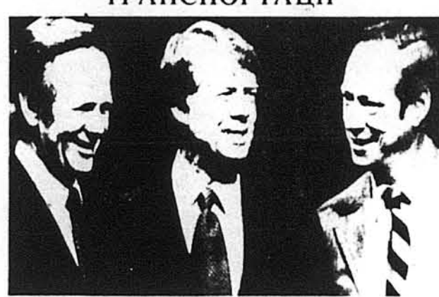
Новообраний Президент з новонайменованими міністрами. На фото (зліва): Рок Адамс, Джиммі Картер та Майкел Блументаль

Атланта, Джорджія. — Під час пресової конференції, переданої на телебаченні і по радіо, новообраний президент Джиммі Картер у вівторок, 14-го грудня, найменував Майкела Блументаль, голову корпорації „Бендикс“ на пост секретаря скарбу, а конгресмена Брока Адамса із стейту Вашингтон на секретаря транспорту. Картер рівнож відповів на ряд запитань, зв'язаних переважно з економічними проблемами країни і того самого дня відбув нараду з посадовими міст і різних частин Америки.