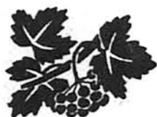
В-во „ЧЕРВОНА КАЛИНА“

ставники уряду Чехо-Словацької Республіки. „Хартія 77“, як відомо, також закликає покінчити з поліційною відплатною акцією і тероризуванням інакомислячих. На пресовій конференції, яка відбулася в Празі в понеділок, 24-го січня ц.р., завербовані компартією і урядом „робітники“, „артисти“ і партійні функціонери, відкидали, як „безвідповідальні“ заклиди дисидентів. На пресконференції, яка своєю формою нагадує такі ж пресконференції в Радянському Союзі, виступало 47 осіб, стягнених міністерством закордонних справ для підтримки урядового становища. Вони усі твердили, що маніфест-це пропагандистський продукт західних розвідок. Текст „Хартії 77“ досі не був опублікований в Чехо-Словацькій, а виступаючи на пресконференції, твердили, що вони його „читали“, або що хтось інший інформував їх про зміст. Офіційна чехо-словацька преса обвинувачувала арештованих дисидентів у „контрреволюції“ і „зраді батьківщини“. Речник компартії заявив опісля кореспондентам, що маніфест був надрукований книжковою і довірливо розісланий видатнішим членам компартії з відповідним коментарем.