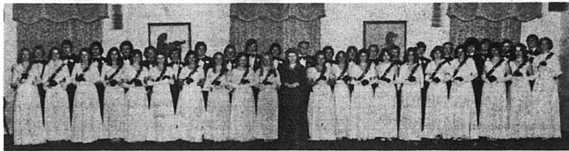
Дебютантки 1976 року