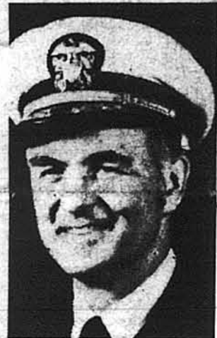
Адм. Стенсфілд Турнер

Вашінгтон. — В середу, 23-го лютого, Сенатська комісія для справ розвідки одногласно підтримала номінацію адмірала Стенсфілда Турнера, дотеперішнього командира збройних сил НАТО в південній Європі і спеціаліста в ділянці флоту Советського Союзу, на два пости: директора Центральної Розвідки Агенції (Сі-Ай-Ей) і на пост координатора діяльності всіх розвідних агентств ЗСА. Якщо цілий Сенат затвердить номінацію адм. Турнера, то він зможе задержати свою військову рангу — повідомив голова Комісії для справ розвідки, сенатор Деніел Інуе з Гаваїв.