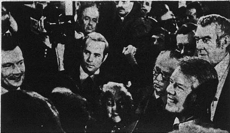
Президент Джиммі Картер (внизу зправа) між кореспондентами після пресової конференції.

В той самий час, коли президент Картер відповідав на питання на цій пресовій конференції, перед Комісією ЗСА для Справ Європейської Безпеки і Співробітництва, яка складається з членів обох Палат Конгресу і представників уряду та яка має за завданням наглядати над додержанням Гельсінкської угоди, свідчив колишній советський дисидент Володимир Буковський, виміняний недавно за лідера компартії Чиле, Луїса Корвалюна. Буковський закликав Захід зайняти «гостре, наполегливе і тривале становище», щоб змусити Советський Союз шанувати людські права і «визнати політичну дійсність». Наступного тижня Буковський має в Білому Домі зустрітись з президентом Картером та віцепрезидентом Волтером Мондейлом.