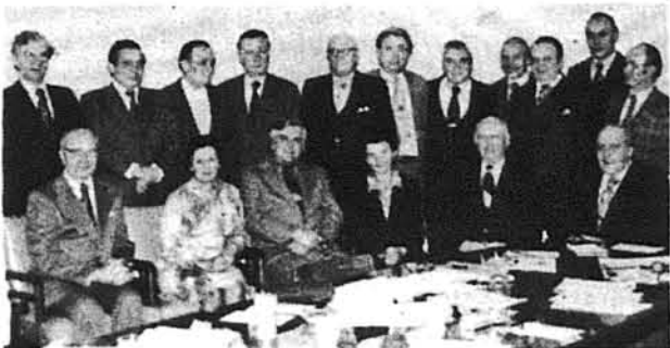
Під час зустрічі представників УККА з представниками УЛТ ПА.