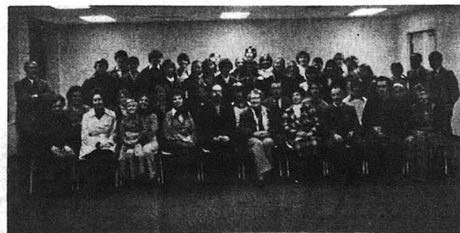
Учні Школи Українознавства при Народному Домі в Трентоні зі своїми опікунами й учителями під час відвідин в Головній Канцелярії УНСоюзу.