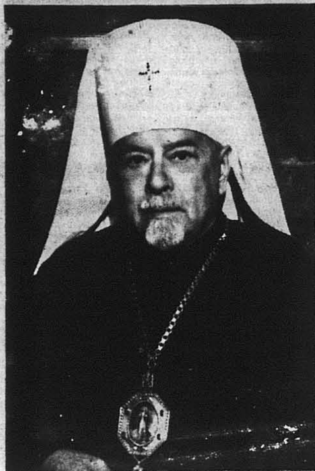
Блаженніший Митрополит Мстислав

Мюнхен, Німеччина. Блаженнішому Владиславу Мстиславу, першому архієпископу Української Автокефальної Православної Церкви і Митрополиту Української Православної Церкви в ЗСА, сповнилося цього місяця 80 років з дня народження. З цієї нагоди тут — як інформують тижневики "Шлях Перемоги" з 16-го квітня, відбулися вчорашні, які включили: