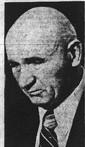
Ген. Петро Григоренко

країні, яка є дійсно вільною і має уряд, вибраний народом, а не нав'язаний йому силою. Ця країна традиційно дає притулок всім переслідуваним з політичних, релігійних, національних та інших причин. Працюючи на користь держави, яка дала мені постійний притулок, я до кінця днів своїх буду служити моєму