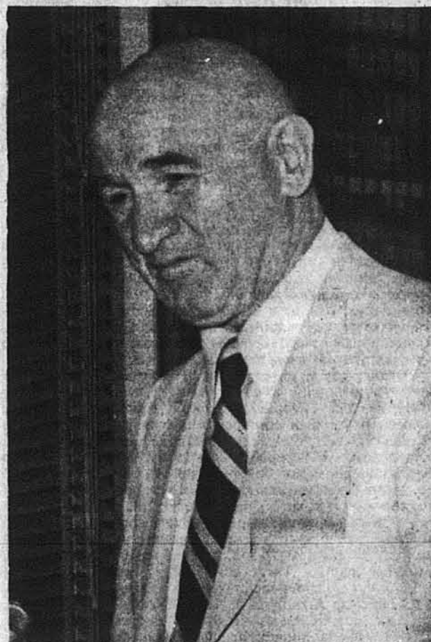
Ген. Петро Григоренко

Ген. Григоренко, який мав промовляти на конвенції сталеварів в четвер, 21-го вересня, сказав, що він дуже зворушений тим, що президент Картер прийняв незнайому йому людину і порівняв це до советського лідера Леоніда Брежнєва, який особисто знайомий з П. Григоренком, але протягом останніх 10-ох років відмовлявся відповідати на будь-які листи ген. Григоренка.