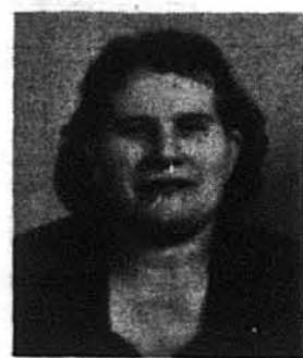
В ПЕРШУ БОЛЮЧУ РІЧНИЦЮ СМЕРТИ Найдорожчої ДРУЖИНИ, МАМИ І БАБУНІ

жуться випадки „нерозв'язаних“ скритовбивств, все вказує, що це нова серія більшовицьких розправ, знаємо, що агентура Москви серед нас поживала свої заходи, знаємо, що останньою появилися нові „оперативники“, знаємо про загострений курс Москви проти вільнолюбивих, а в першу чергу національних течій, отже добре є пригладити собі давні історії, повчитися з них і — найважливіше — бути на осторозі.