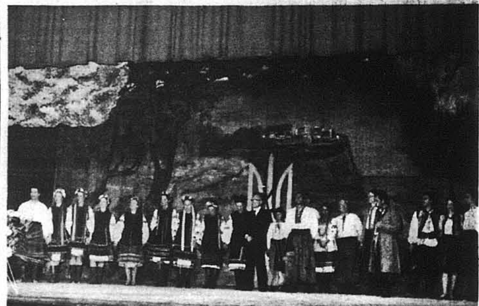
Артисти Ансамблю „Українська Опера“ під час свого виступу в Чикаго.