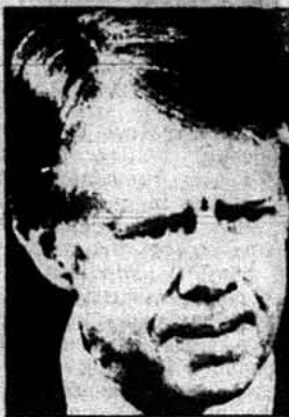
Президент Джиммі Картер

ли прихильники Хомейні, тодішній уряд, що його має очолювати прем'єр Базарган, то Америка готова співпрацювати з тим урядом, що між Іраном і ЗСА відносини далі будуть приязні.