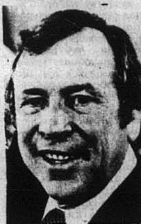
Сен. Говард Бейкер

Деякі коментатори вважають, що повільна кампанія сенатора Бейкера й нерішучість у проголошенні своєї кандидатури залишили його значно позаду колишнього губернатора Каліфорнії, також республіканця, Рональда Рігена. До цього зрештою признається сам сенатор Бейкер, кажучи, що він є другим щодо популярності республікан-