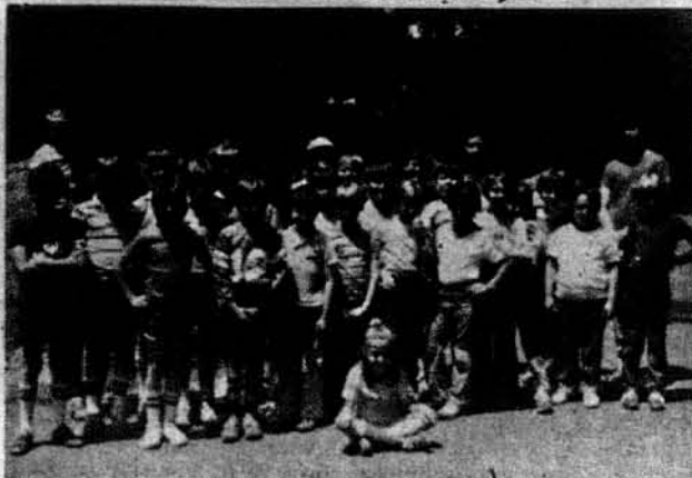
Учасники дитячого табору.