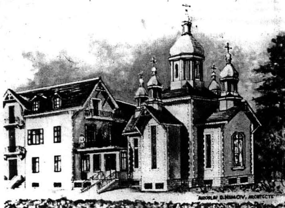
Українська католицька церква і будова в Лорді.

Будова вимагає також нової інсталляції опрівання, електричного освітлення та санітарних улаштувань. Буде нова кухня, дві великі їдальні, сходи тощо. Коли буде закінчений цей проєкт, а має це статися до літа нас-