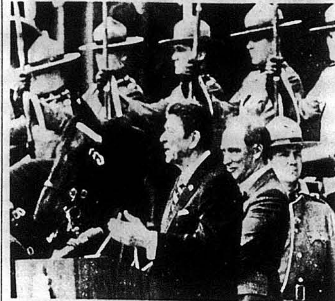
Президент Роналд Реген і прем'єр П'єр Трудо під час привітання біля парламенту в Оттаві. Це була перша поїздка новообраного Президента ЗСА за кордон.

Оттава, Канада. — Відвідини президента Роналда Регена в Оттаві були повністю використані обидвома сторонами для всебічного з'ясування своїх позицій і постулатів.