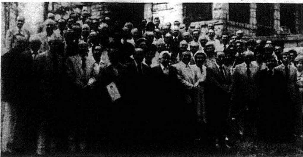
Учасники Конференції ЦУКА