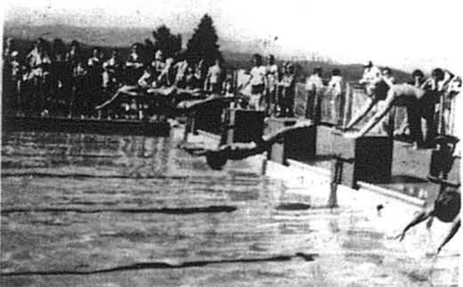
Майбутні олімпійські пливачі готуються до перегонів, чи вода в басейні тепла, чи холодна змагання йдуть вперед.