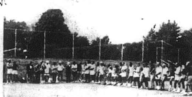
Тенісовий табір, а потім тенісові змагання збирають силу глядачів і учасників. Тут учасники вишикувалися в лаву по заслужені трофеї, які вони ось-ось дістануть.

Діло ж його рук і серця Союзівка переїде тоді в інші, молодші руки. І хоче він, щоб виконувала і далі ту колосальну роботу для української людності, як досі, Мріє директор, що такою вона лишиться назавжди. Вона — це не один „голідей ін“, а оселя українська, бо „якщо б стала вона ще одним готелем, то хто ж тоді іхав би за сотні й тисячі миль сюди на вакації? Дух український — ось її найбільша принада“. Такою Союзівка є тепер, такою була і такою має лишитися на дові-довгі роки нашого тут перебування. Вона є і буде клаптиком України, завжди рідної, завжди незабутньої і завжди найдорожчої. Богом даної нашому народові, землі. Тож — до побачення на Союзівці, бо тут як ніде!