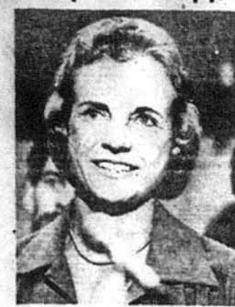
Сандра Дей О'Коннор

Вашінгтон. — Президент Роналд Реген повідомив у вівторок 7-го липня ц.р., що він номінує жінку, 51-річну Сандру Дей О'Коннор, суддю апеляційного суду в стейті Аризона, на опорожнене місце у Найвищому Суді ЗСА. Сандра О'Коннор, після затвердження її номінації Сенатом, буде першою жінкою, яка служитиме на цьому високому становищі.