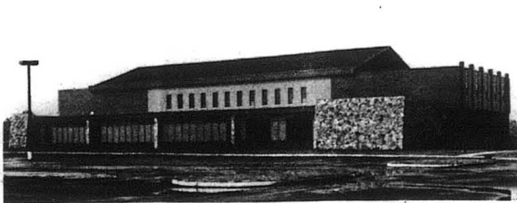
Новозбудований Дім Української Культури.

Савт Бавнд Брук, Н. Дж. (Л. Волянська). — Коли говориться про Осередок УАПЦеркви Савт Бавнд Бруку, як про „Українську Мекку”, а то й додається до цих двох слів ще й фразу „для українців усіх віровизнань”, то в деякого з тих українців, що не православні, може зродитися сумнів, чи це справді так. Але той сумнів зникає, коли відвідаєш цю імпульсанти 100-акрову посілість Української Православної Церкви, Осередок УАПЦ, що йому тепер вже легка ціна понад дев'ять мільйонів доларів. Він постає тут завдяки трудові Митрополита Владимира Мстислава, голови Української Православної Церкви в ЗСА і Первоєрарха Української Православної Церкви в діаспорі.