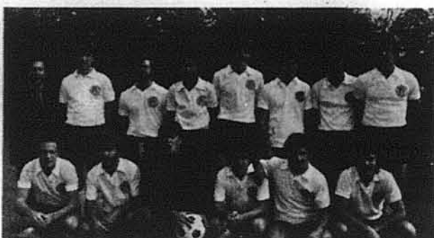
Перша дружина УСО „Тризуб“ Філадельфія в сезоні 1981/82