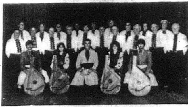
Ансамбль бандуристів „Гайдамаки“

В околиці Пасейк-Кліфтон, Нью Джерсі, оселилась велика кількість українців зі старої і нової еміграції. Тут є три українські церкви, три відділи Українського Народного Союзу, Кредитівка, жіночі та молодіжні організації. Зусиллям цих організацій постала в Пасейку велика Українська Центральна, де щовечора ці організації проводять свою роботу. І на славу цій громаді найбільше рухливий тут молодіжний організацій. І тут і серед молоді, і батьків люди, які заслужують на увагу.