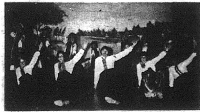
Танцювальний Ансамбль „Дунай”

здобула спочатку ступінь бакалавра, потім магістра і вкінці з високим відзначенням — доктора філософії з музикознавства.