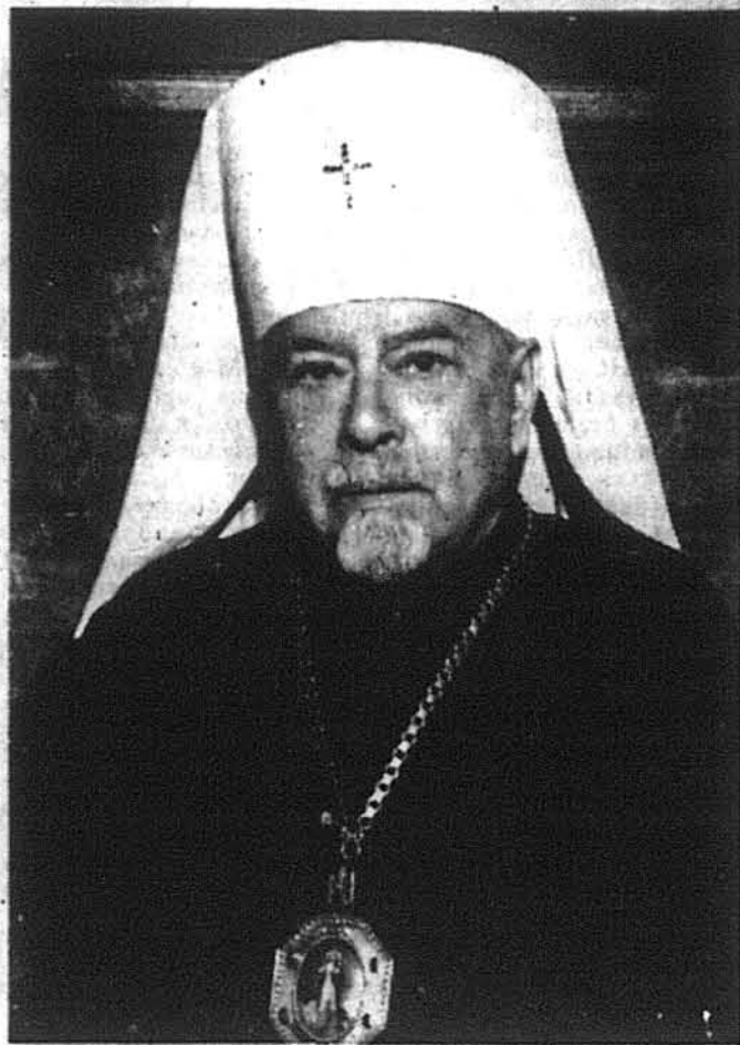
Блаженніший Владика Мстислав

У день сорокаріччя архиєрейської хіротонії та 84-річчя з дня народження Блаженнішого Владика Митрополита Мстислава, Первоієрарха Української Православної Церкви в ЗСА та діаспорі, колись воїна Української Армії, парламентариста-законодавця союму, тоді ж видатного трибуна і оборонця свого рідного народу перед всілякими утисками чужого уряду, а пізніше — видатного духовника, позначеного печаттю Божої харизми, борця за ідеали українського та загальнолюдського добра і справедливості — бажаємо йому Многих Літ і ще довгої плідотворної праці на чолі УАПЦеркви.