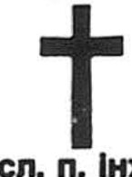
сл. п. інж.

ділитися сумною вісткою з своїм Членством та Українською Громадою, що в суботу, 21-го серпня 1982 року, відійшов у Вічність на 74-му році трудовитого життя наш Дорогий Друг