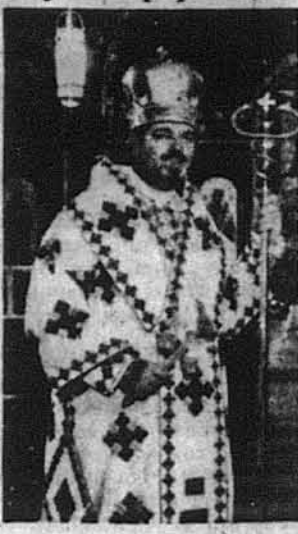
Єпископ В. Лостен

Стемфорд, Конн. — Єпископи-члени першого району Католицької єпископської конференції у четвер, 18-го листопада, одностайно вибрали українського католицького єпископа, Владика Василя Лостена, єпарха стемфордського, президентом Конференції району, який обіймає всі стейти Нової Англії.