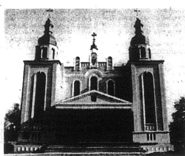
Новозбудований храм св.Покрови

Рочестер, Н. Й. (Ф.К.Лютенський). — Неділя, 28-го листопада 1982-го року залишилася пам'ятковою датою української православної громади в Рочестері, Н. Й. В цей день Архiepіскоп Марко посвятив новозбудований храм української автокефальної православної церкви святої Покрови. Невелика чисельністю українська православна громада Рочестеру спромоглася на величний храм, котрий без сьогоднішньої модернізації, як це видно з будов інших храмів, нагадує собою одну з багатьох тисяч храмів — перлину українсько-козацького бароко, що їх безжалісно поруйнували московсько-комуністичні безбожники в Україні. Ось такий храм виріс на вільній землі Вашингтона завдяки жертвенності і тяжкій кропітливій праці цієї малесенької горсточки української громади, що знайшла своє притулище після жакливої Другої світової війни. Величний п'ятибанный храм притягає погляди і зачудування не лише українців, але й не-українців, які похвально висловлюються про красу храму як знамору, так і в середині його. Місцеза англомова преса похвально і з признанням інформувала своїх читачів про храм святої Покрови, що виріс при 3176 Сейнт Пол бульвар на передмісті Айрондейквіт — Рочестер. Тому в самий день посвячення храму зібралася