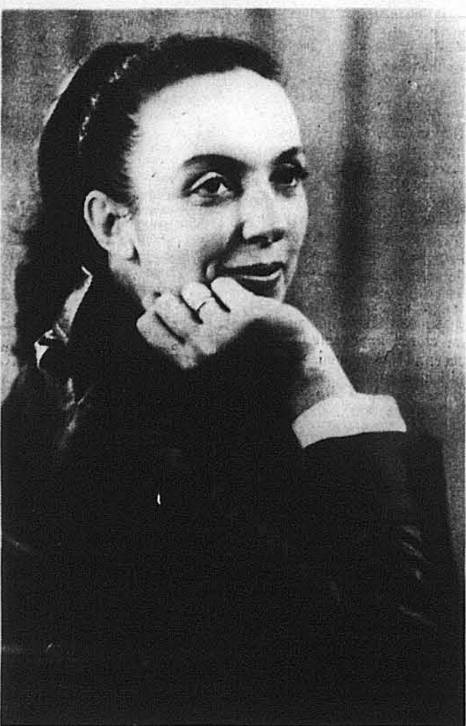
Ірина Калинець (під час відвідин Львова, фото 1979 року).