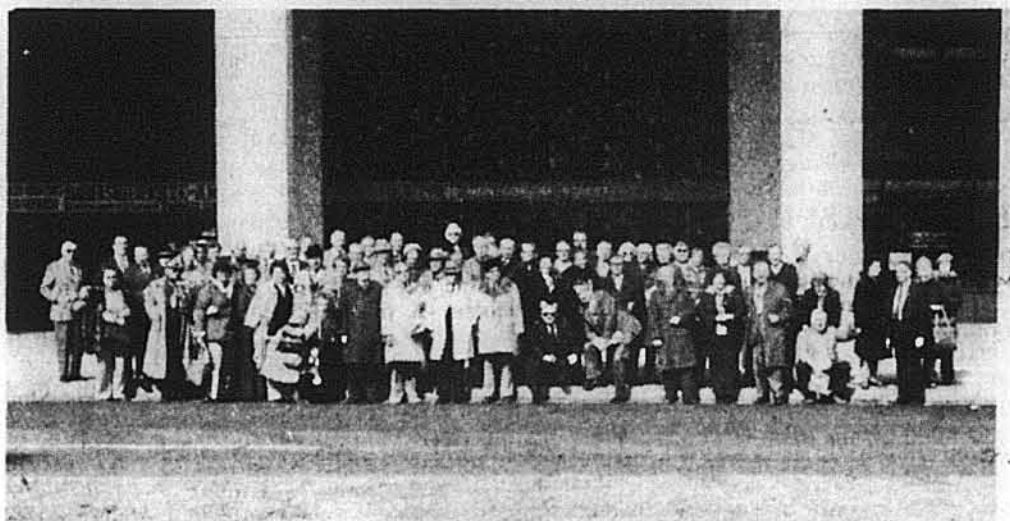
Прогулянковці з Філадельфійської Округи перед будинком УНС.