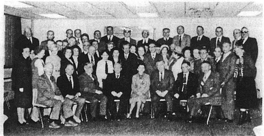
Філадельфійці з членами Головного Екзекутивного Комітету