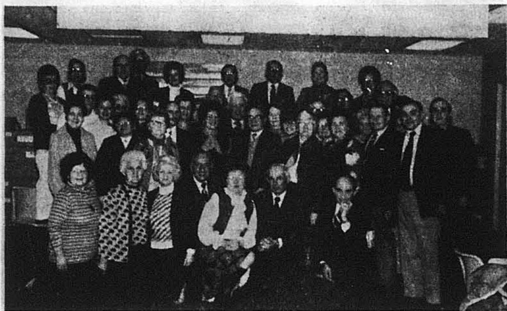
Прогулянковці, які прибули з Честеру.

Після цієї екскурсії дещо втомлені гості повернулися до великої конференційної зали УНС, де їх вже чекав обід — гостиня, який приготували союзові урядники Геневфа Куфта і Богуслава Полішук. Гостей, які