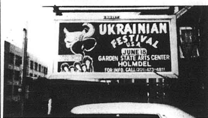
Одна із таблиць на головних дорогах