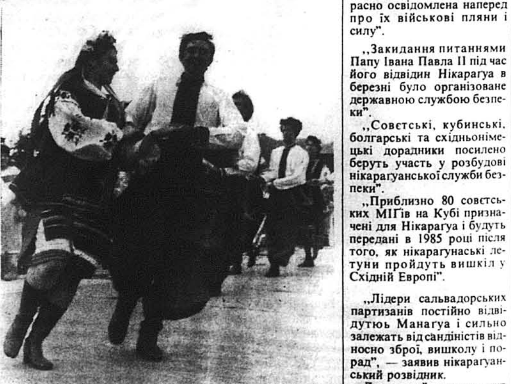
Танцюристи Українського Танцювального ансамблю.

Вже вранці розпочалися спортивні змагання у програмі Фестивалю. В турнірі копаного м'яча, що у ньому брали участь п'ять дружин — три українські й дві американські, — перше місце здобув Український Спортивний Клуб Нью Йорку. Друге місце припало дру-