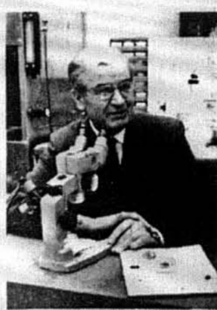
Св. п. д-р О. Смакула

ла захопився вітамінами. Це зацікавлення походило з його студії над стерейдами. Він вступив до новоствореного Кайзера Вільгельма Інституту для медичних дослідів у Гайделберзі як керівник оптичної лабораторії. В цьому інституті вчений співпрацював з Рихардом Кунем (отримав нобелівську премію 1938 р.) і зробив видатні відкриття, що торкалися зв'язку між структуральними й оптичними властивостями вітамінів і багатьох інших органічних сполук.