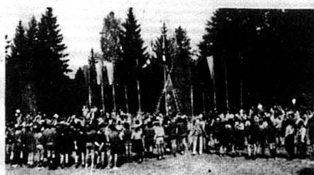
Юнацтво виводить вузол дружби на відкритті ЮМПЗ.