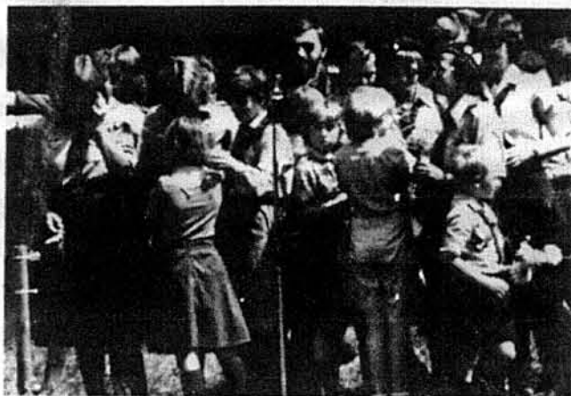
Юнаки і юначки передають квіти виховникам.