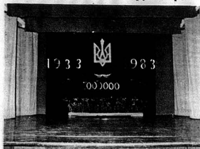
Сцена під час вшанування жертв Великого голоду.

Заходами Громадського комітету для відзначення голодомору в Україні та при співпраці Комітету Поневолених Націй, в неділю 30-го жовтня, відбулася у місцевому Українському Народному Домі друга частина відзначення цієї сумної річниці. Перша частина, для української громади, відбулася у травні цього року, і про це писала місцева американська та українсько-американська преса, інформувала про неї також телевізійна мережа.