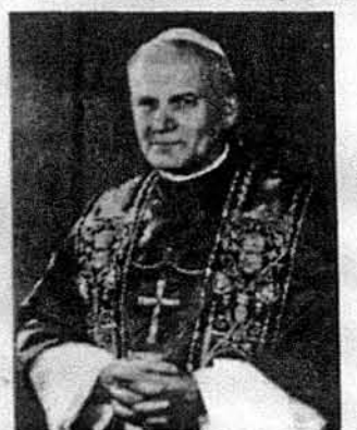
Папа Іван Павло II

Митрополит Вінніпегу і всієї Канади Кир Максим привітає Святішого Отця