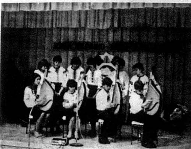
Учні українських шкіл на Фестивалі Живого Слова.

За традицією вже Фестиваль Живого Слова відбувся в останню суботу і неділю травня, 26-го і 27-го, в приміщенні школи св. Софії в Миссисага біля Торонто. До участі запрошено всі рідні нашого шкільництва, від садочків до курсів українознавства, у ділянках декламування, рецитативної, інсценізацій, інструментально-вокальних виступів та інших.