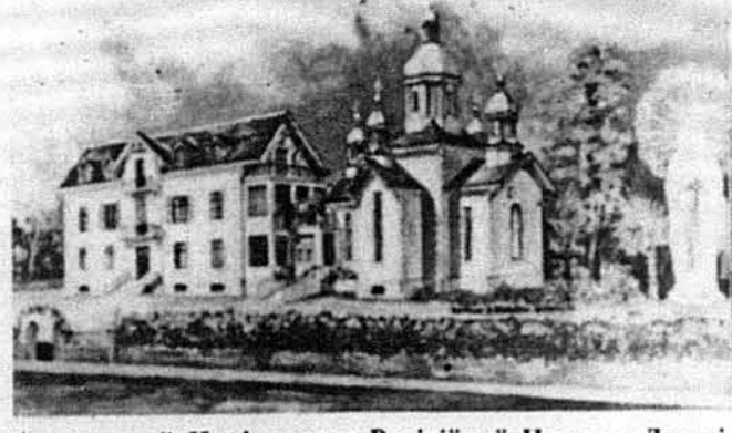
Український Національно-Релігійний Центр у Люрді