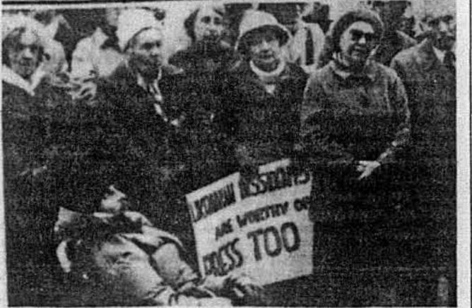
Група учасників демонстрації біля П. Стокотельного.

ЛІКАРІ ОСТЕРЕГЛИ ГОЛОДУЮЧОГО, А ПРЕДСТАВНИК УРЯДУ ЗСА ПОВІДОМИВ ПРО ЗАПЛЯНОВАНИЙ ПРОТЕСТ