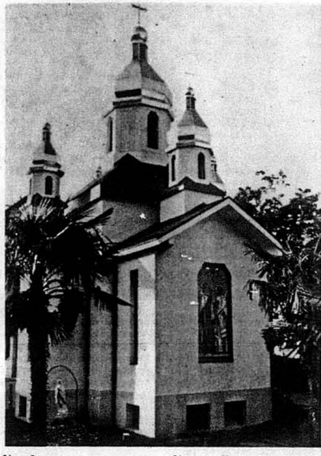
Українська католицька церква Успення Пресв. Діви Марії