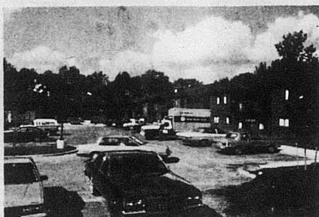
Оселя для старших віком українців Українське Село в Воррені.