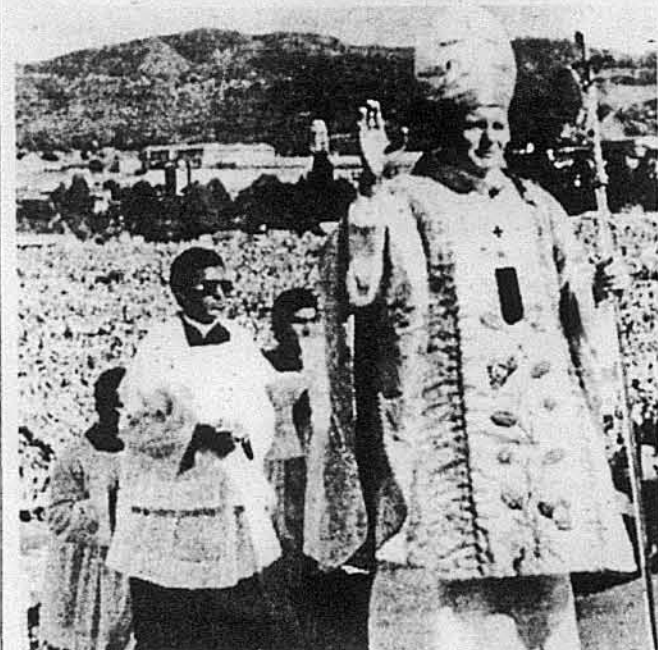
Папа Іван Павло II підходить до вітання перед Богослужінням в Каракасі.

АМЕРИКАНСЬКЕ ВИДАВНИЦТВО Даял Пресс — Даблейд опублікувало тепер книжку японської автorkи п. н. "Журавлі у сумерку". Фабула якої діється в 1945 році у японському місті Кіото, яке зайняли американці. Найцікавіше однак при цьому є те, що японська автorka Гітсако Матсубара пише свої повісті лише в німецькій мові і саме з німецької мови зроблений тепер переклад першої її повісті на англійську мову. Вона одружена з німцем і почала свою письменницьку кар'єру як журналістка німецького тижневика "Ді Шайт".