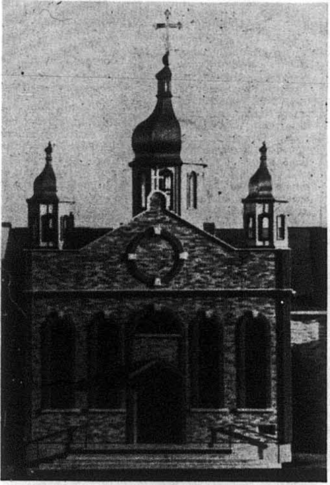
Новозбудований собор парафії св. апостола євангелиста Луки в Варнері, Н. Й.

Третього листопада 1985 року освячено новозбудований храм Божий УПЦеркви в Варнері, в околиці Сиракуз м'ясоперейської стейту, парафії святого апостола євангелиста Луки.