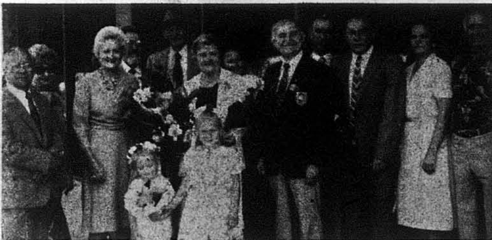
Представники української громади зустріли голову СКВУ Петра Саварина з дружиною Оленою (стоять посередині) на летовищі в Канберрі.

привозять росіяни та інші народності із національних меншин союзу імперії... про нищення нашої культурної спадщини, про запровадження насильної русифікації тощо. Наша американська еміграція, яка в основному походить із земель Закарпаття та Галичини, має столітній вік... Але не дивлячись на те, що прожили століття на чужині, вони зберегли свою Церкву, культуру, традиції і мову, вони не втратили своєї національної ознаки. Після Другої світової війни прийшов другий приплив нашої еміграції, але трохи відмінний від першого тим, що перша еміграція була заробітчанська, а нова еміграція більш зполітизована, бо причини її еміграції були ідеологічно-політичними. Обі ці еміграції потребували довгого часу на перетрактації і підготовку до організаційного процесу створення своєї національної репрезентації, що носить тепер назву — Світовий Конгрес Вільних Українців. Створення СКВУ — це пряму чужою еміграційної патріотичної спільноти... Перша світова війна пробудила українську націю, і це національне пробудження завершилось створенням уряду УНРеспубліки, а в процесі короткого часу завершилось актом соборності української землі.