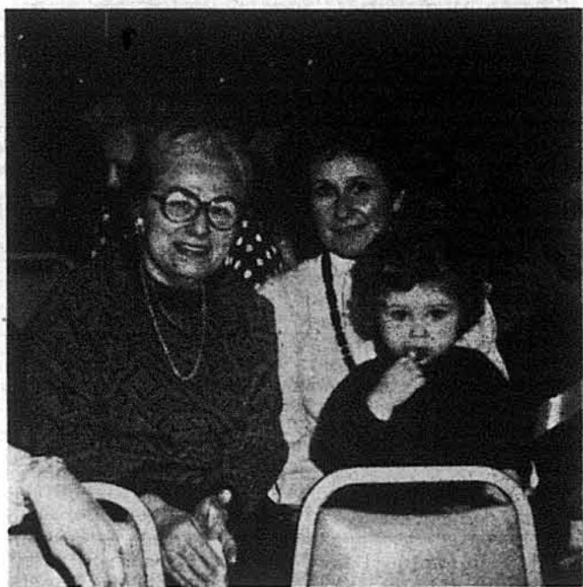
Три покоління вітають св. Миколая

Свято Миколая — це велике дитяче свято в парафії, це теж і небуденна подія побачити стільки дітей в один час. А які чудові реакції дітей, глядачів. Вони піддаються звукам танцювальних мелодій та й собі підтанцюють. Бабці обтирають сльозини, матерів гордоші „розпирують” (осо бливо за тих, що виступають), а батьки бігають з апаратами, щоб „увічнити” своїх малих артистів. Зал