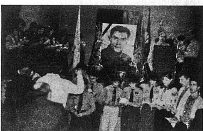
Молодь вшановує В. Стуса

ської молоді із свічками. Похід вели прапороносці. Під звуки бандур, до мелодії повстанської пісні, піднявся спів на слова Василя Стуса: „Як добре те, що смерті не боюся, і не питаю, чи такий мій хрест”. Присутні у переповненій залі підхопили спів на слова Стуса і дали всі разом співа- лі: „Що вам, лукаві судді, не клонюся в передчутті невідомих верст...” Це була настільки зворушлива хвилина, що на залі у цей час напевно не було ні одного сухого ока. З кінцем пісні, прапороносці обступили на