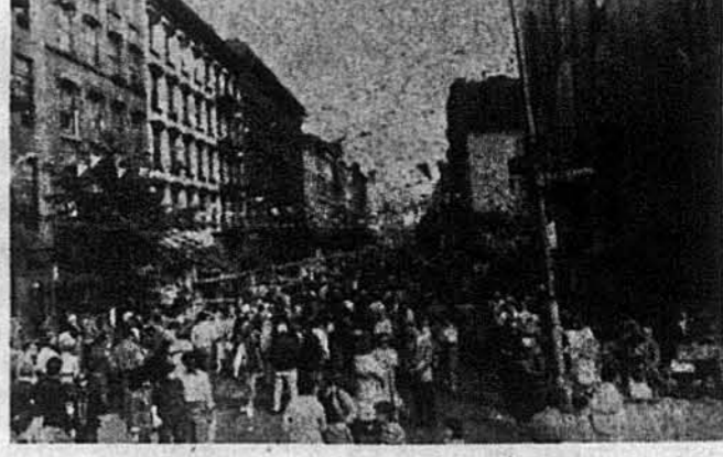
Під час минулорічного Фестивалю церкви св. Юра