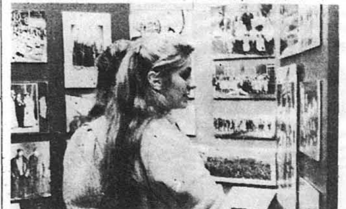
Учениці Школи Українознавства СУМ-у в Нью-Йорку оглядають виставку „Історія української іміграції в Америці”.

ВИДАЄ УКРАЇНСЬКИЙ МУЗЕЙ Редагує Комісія Преси і Публікацій Адреса: 203 Second Avenue, New York, N.Y. 10003