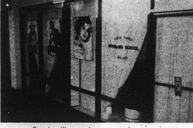
Зовнішній вигляд школи моделювання