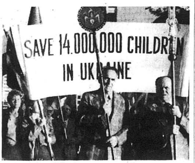
Демонстранти в поході.